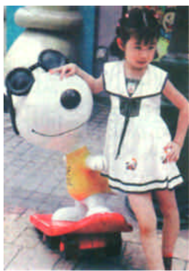
五月二十日是香港公众假期，位于沙田新城市广场的“史努比开心世界”主题公园自一年秋开放以来，深受游客尤其是孩子们的青睐。