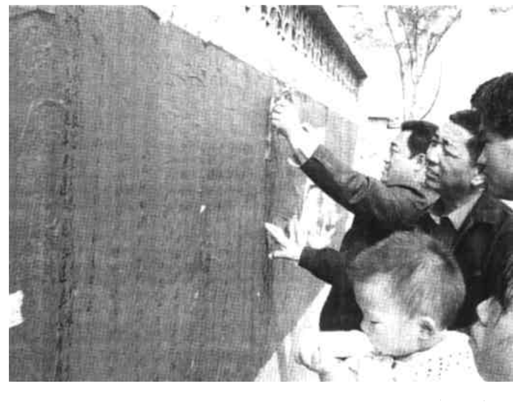
东营区六户镇的包村干部坚持工作在农村税费改革第一线，扎实稳妥、有序地推进了全镇税费改革工作。图为农民在观看税费改革宣传图。

大家知道，在全国各地开展的文化科技卫生“三下乡”活动、中央电视台“心连心”艺术团、“科技大篷车”等，由于用群众喜闻乐见的形式，承载着丰富鲜活的内容，解决了群众遇到的实际问题，丰富了群众的文化生活，受到群众的热烈欢迎，成为人民群众心目中津津乐道的优美形式。远的不说，在我市基层创造产生并得到推广的“集中定时定点办公”、“一线工作法”、“政策进农家”等有效新颖的形式，同样受到群众的广泛好评。