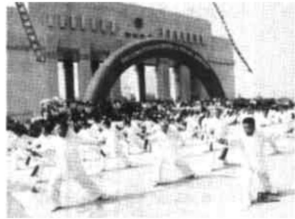
图一:开发区金光艺术团演出的《健身大秧歌》。 图二:市武术协会表演的《四十二式太极剑》。

本报讯 日前,市中级人民法院作出决定,在受理执行案件时,不再向申请执行人预收申请执行费和执行中实际支出的费用,待执行结束后收取。收费的范围和标准,还将按照原来的有关规定和要求办理。据悉,这一决定是根据省法院《关于进一步规范执行工作的意见(试行)》的要求作出的。其目的是最大限度地解决和防止收费过程中发生的各